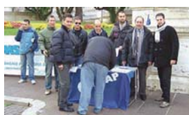
Un'immagine della protesta davanti al Quirinale