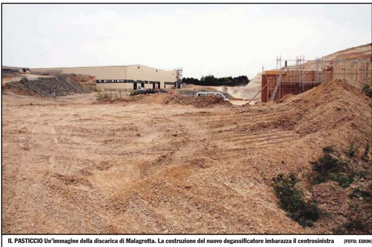
IL PASTICCIO Un'immagine della discarica di Malagrotta. La costruzione del nuovo degassificatore imbarazza il centrosinistra