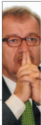
Il ministro dell'Interno, Roberto Maroni, rivendica i successi sul fronte della lotta alla criminalità organizzata

ROMA - Oltre quattromila tra agenti di polizia e carabinieri. Circa seicento vigili del fuoco. Sono questi i numeri attesi per le nuove assunzioni annunciate dal ministro dell'Interno, Roberto Maroni. «Le nuove assunzioni - spiega il ministro - serviranno per integrare le forze dell'ordine per un dispositivo sempre più efficiente». Tra gli obiettivi prioritari dell'esecutivo, la lotta alla criminalità organizzata, che, ad oggi, ha visto il sequestro di 28.700 beni per un valore di quindici miliardi di euro e la confisca di 5.900 beni pari a tre miliardi di euro. (V.Ar./ass)