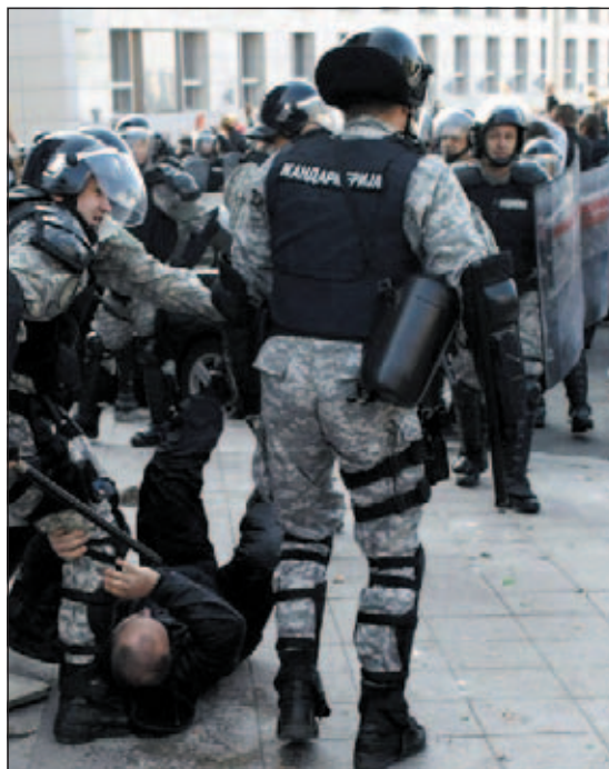
Belgrado, scontri tra polizia e nazionalisti serbi