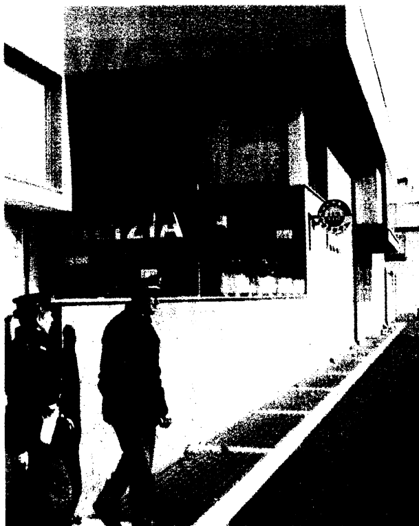
Commissariato Sono spesso necessari rinforzi

■ Settanta poliziotti per 65mila abitanti e un'unica pattuglia operativa. Ovvero un agente ogni 900 residenti. I numeri si riferiscono all'attuale organico del Commissariato della polizia di Stato di Fiumicino. Dati alla mano che paragonati a quelli del 1992, anno di costituzione del Comune, rivelano una diminuzione del personale di via Portuense nonostante l'aumento della popolazione.