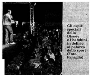
Gli ospiti speciali della Befana e i bambini in delirio al palazzetto dello sport

OSTIA - Un «evviva» gridato in coro dalle centinaia di bambini presenti all'arrivo di Minnie e Topolino, urla di gioia all'«atterraggio» delle due Befane che con doni e calze hanno fatto sorride-