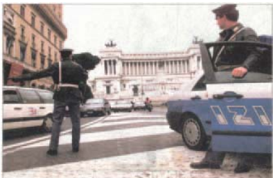
I sindacati di polizia «Di notte girano solo nove volanti»

Il braccio di ferro tra sindacati di polizia e il Questore nella gestione del territorio romano è un momento. Il Comsup, infatti, l'ultimo nella gerarchia di comando dopo il Questore, ha appena varato un piano di controllo del territorio che prevede la presenza di nove volanti per notte.