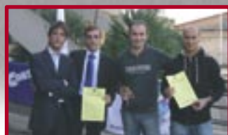
S.O.S. Sicurezza Roma