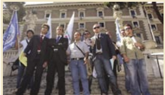
La manifestazione di protesta della Consap con il volantaggio davanti al ministero dell'Interno