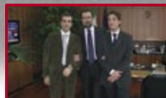
Direzione Centrale Anti Crimine