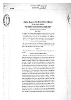
Il frontespizio dell'accordo ERP

La visita del presidente degli Stati Uniti, creò agitazione nel Governo di allora, soprattutto per quanto riguardava l'organizzazione dei servizi di sicurezza, in quanto in tutto il territorio nazionale erano in corso agitazioni sindacali volte a contestare la visita dell'illustre ospite internazionale. Da molte città italiane partirono cortei di protesta verso la capitale, con il consueto supporto di numerosi gruppi violenti guidati da pseudo sindacalisti progressisti e contestatori addestrati alla