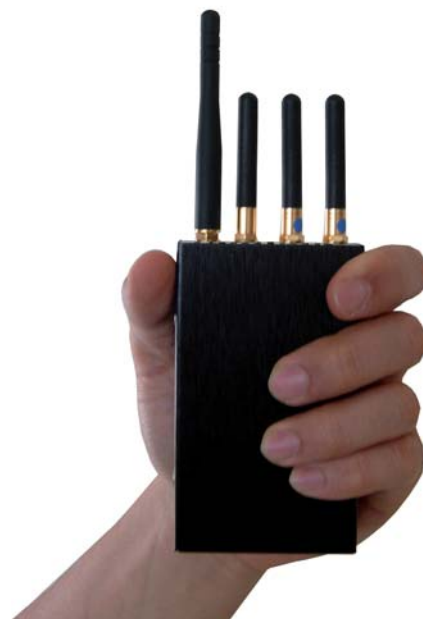
Disturbatore satellitare portatile

In conclusione possiamo dire che il vero antifurto sono le Assicurazioni ma è meglio scegliere una polizza chiara e senza clausole sfavorevoli.