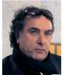
Pietro De Rosa Vice Questore

All'indomani del cambio di governo alla Regione Campania, al ventilato stop al reddito di cittadinanza e nell'imminenza della scadenza di alcuni progetti riguardanti i senza-lavoro (in particolare, "B.r.o.s.", Budget di reinserimento occupazionale e sociale, ex progetto "I.so.la."), è riscoppiata la protesta violenta dei disoccupati organizzati di Napoli e provincia, con alcuni feriti tra gli appartenenti delle Forze dell'Ordine.